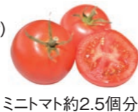
ミニトマト約2.5個分