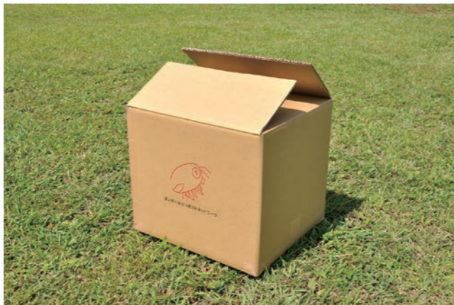
「たい肥の使い道がない…」という方もご安心を。出来上がったたい肥と基材(たい肥の元)の無料交換も行っています。