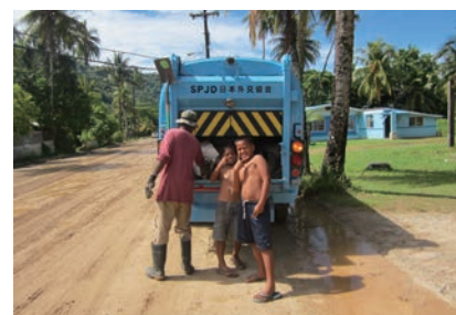
▲外務省の制度を通じて寄贈した収集車

そこで、今年度から3年間、JICA(独立行政法人国際協力機構)の制度のもと、問題改善に取り組みます。現地では、ごみ収集業務の改善や住民への啓発活動などを公募により決定した創価大学と共に行います。詳細は、市のホームページで随時公開します。