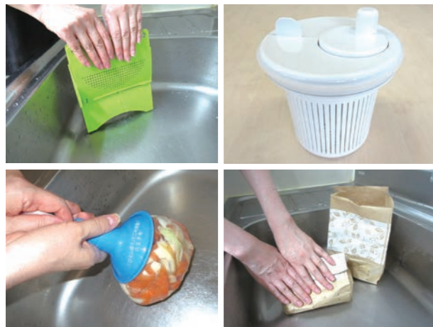
おしゃれで、簡単に水を切れるグッズもあります。