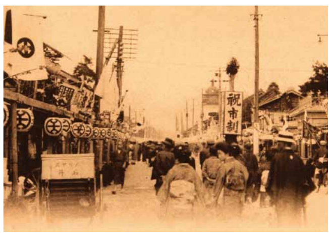
市制施行祭(大正6年)