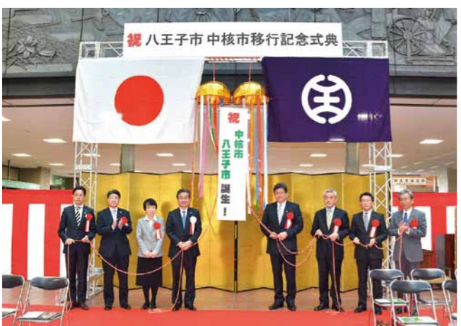
中核市八王子が誕生(平成27年)