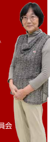
市制100周年記念事業実行委員会 企画支援委員会委員長