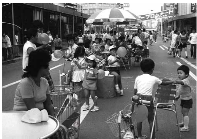
甲州街道での歩行者天国(昭和47年)