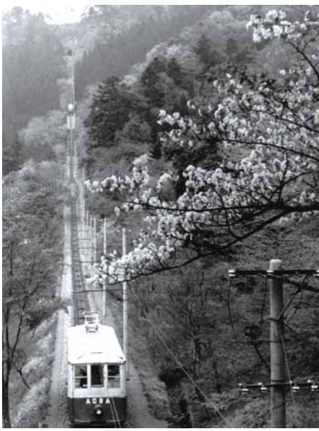
高尾山のケーブルカー(昭和23年頃)