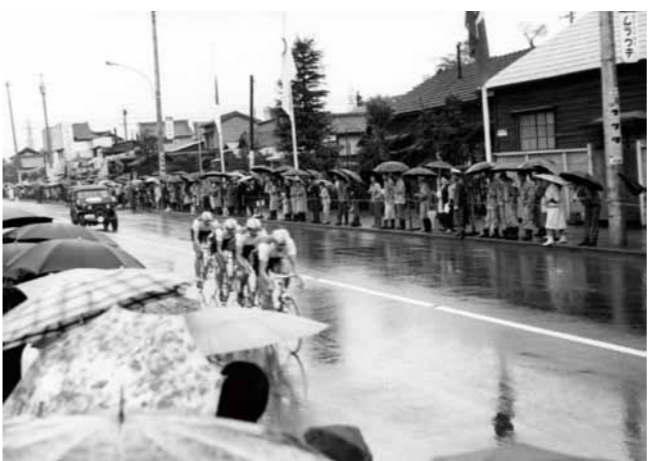
東京オリンピックでの自転車競技(昭和39年)