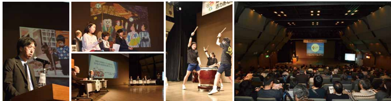
ビジョンフォーラムのキックオフとして、平成29年2月5日にクリエイトホールで開催した市民フォーラム・未来を語る

今年度は、「輝きの100年」「未来への一歩」をコンセプトに八王子の魅力を引き出す8つのテーマ(下表参照)で記念事業を展開していきます。まちが誇る地域資源を最大限に活用し、市民の皆さんとともに「100+α」のイベントを開催し、八王子の自然や歴史、文化など、多彩な魅力を市内外に発信します。