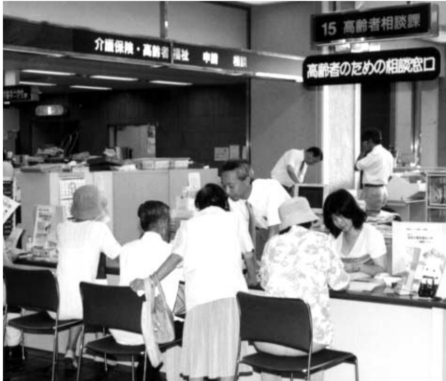
サービス利用の支援と苦情などの早期解決をめざして