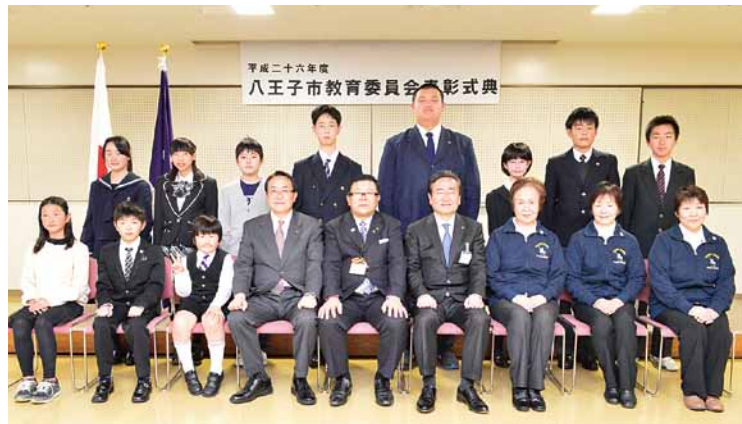
▲市長、教育長をかこんで(3月16日の表彰式典にて)

平成27年3月16・17・26日に「市教育委員会表彰式典」を市役所本庁舎で開催しました。市教育委員会表彰は社会的に評価される活動や優れた能力、努力をたたえ、周囲の模範として広く知らせるとともに、市民のスポーツの振興、ボランティアの奨励を目的としています。 対象者は、スポーツや芸術文化、ボランティア活動など、さまざまな分野で活躍した児童・生徒や市民の方と、小・