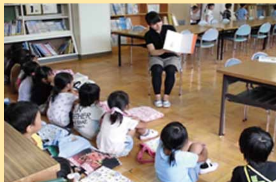
▲ボランティアによる絵本の読み聞かせ

電子書籍の導入や貴重な郷土資料の電子化、子どもや若者に読書に関心をもってもらえるようホームページを充実するなど、ICT(情報通信技術)機器を利用したサービスの充実を図ります。