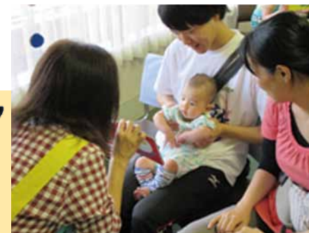
▲絵本をひらく時間の楽しさを体験

乳幼児には「ブックスタート」事業を、児童・生徒には夏休みに体験学習を実施するなど、さまざまな事業を展開していきます。