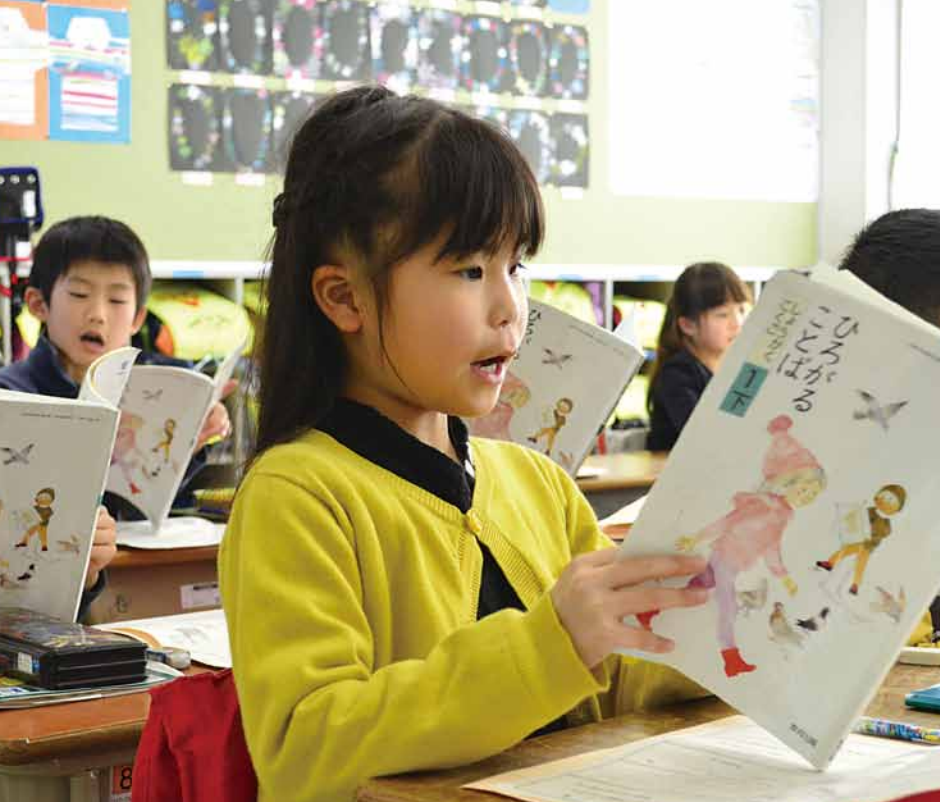
▲想像を広げながら読むこと的能力を身に付ける

義務教育段階では、生涯にわたる学習の基礎となる「生きる力」を育成することが大切です。「確かな学力」「豊かな心」「健康なからだ・体力」の三者のバランスに加え、これらを支える「食」を柱に、一人ひとりを大切にする教育を行います。 また、保育園や幼稚園などの就学前の保育・教育から、義務教育9年間を見通した継続性・連続性のある教育活動により、子どもたちの円滑な学校生活のスタートと学校卒業後の社会生活とのつながりを意識した教育を進めていきます。