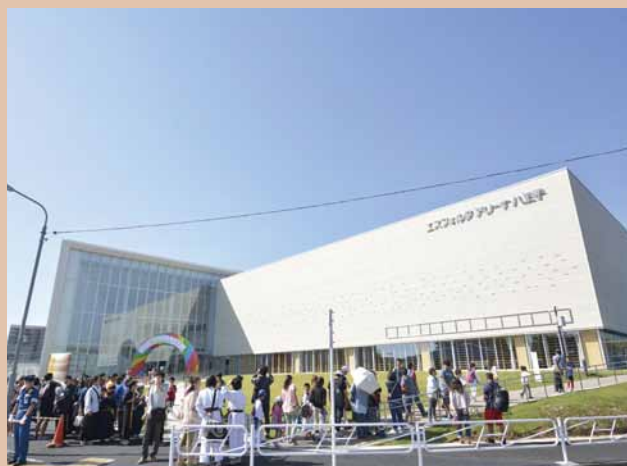
▲市民が気軽にスポーツを楽しめる総合体育館

生涯学習活動を始めたい方や学習をより深めたい方に対し、講座やサークル活動、ボランティア参加などの情報を分かりやすく提供するとともに、相談体制を拡充させます。また、学校やスポーツ施設など市の公共施設を積極的に提供するとともに、大学や企業などと連携し、学習の場がさらに広がるよう、生涯学習環境の充実を図ります。