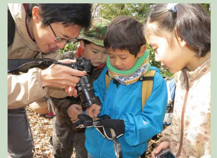
▲植物や虫を観察する自然体験学習