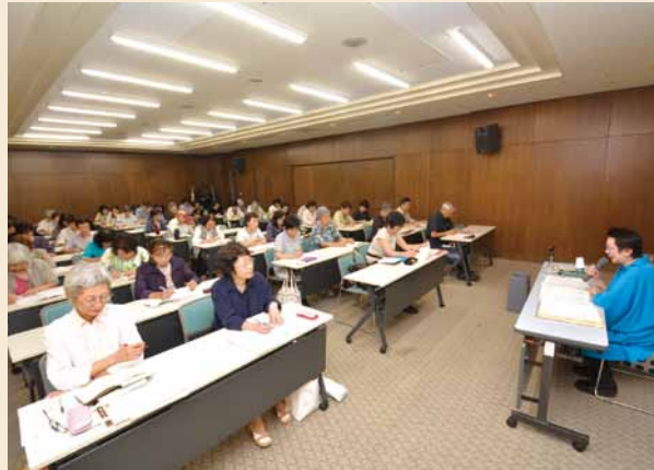
▲身近な場所でさまざまな講座を実施

誰もが、いつでも、どこでも生涯にわたり学ぶことができるよう、読書やスポーツ・レクリエーションをはじめ、多様な学習の機会を図書館や生涯学習センターなどのさまざまな場所で提供します。講座やイベントを実施する際には、市民がもっている知識と経験が活かされるよう、市は人とひと、団体と団体を結びつける役割を果たしていきます。