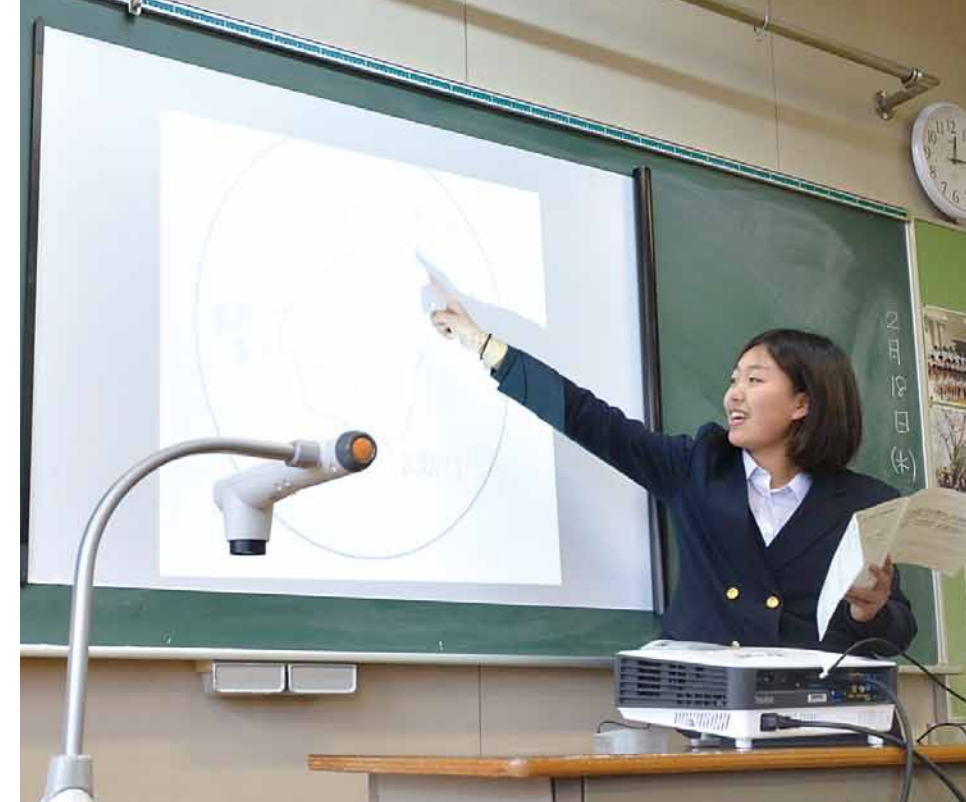
▲投影した資料をもとに学習の成果を発表

子どもたちの学習への意欲を高めるには、教員一人ひとりの資質や能力を向上させ、質の高い授業を行うことが必要です。中核市への移行にともない、教員の研修をより発展したものとし、子どもたちの学力や体力の向上、心の教育を充実させていきます。 また、情報化が進むなかで、プロジェクトや書画カメラなどのコンピュータ機器を活用した学校ICT(情報通信技術)環境の整備を推進し、学習環境を充実させ、子どもたちの学びを支えていきます。