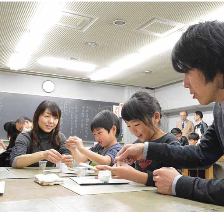
▲親子一緒に楽しめるこども科学館での工作教室

4～6ページでは「八王子市生涯学習プラン」「第3次読書のまち八王子推進計画」について紹介しています。