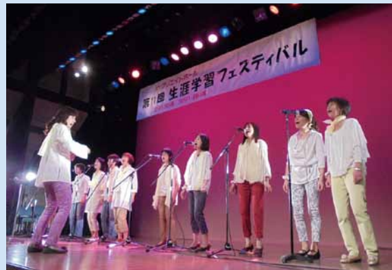
▲ステージで日ごろの学習成果を発表