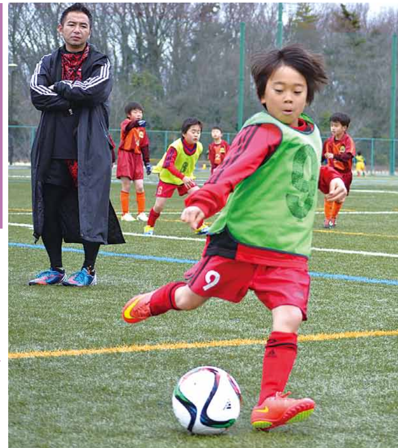
▲子どもの頃からスポーツに親しんで