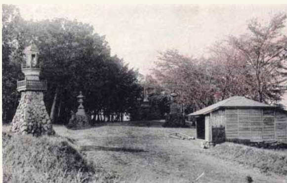
▲絵葉書で紹介された明治時代の富士森公園