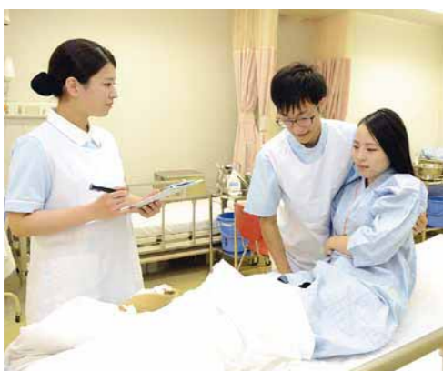
▲優しく寄り添う看護師に

対象 高卒(見込み可)、または同等以上の学力を有する方 試験日 一次試験：1月24日(日)、二次試験：1月30日(土) 募集人員 40名(選考。社会人入試枠の合格者を含む) 受験料 4千円 申し込み 同校で配布する募集要項に添付している入学願書に必要事項を記入して、12月14～28日(消印有効)に郵送で同校(〒193-0944館町1-16 ☎663・7170、☎662・9691)へ