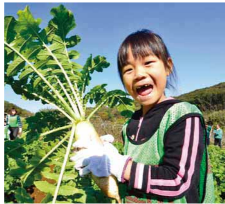
▲わくわくダイコン掘り体験

対象 市内在住で就学前のお子さんと保護者(1家族4名まで) 内容 野菜の収穫体験、ハイパーレスキュー隊見学、保育士