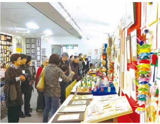
▲趣向を凝らした作品の数々