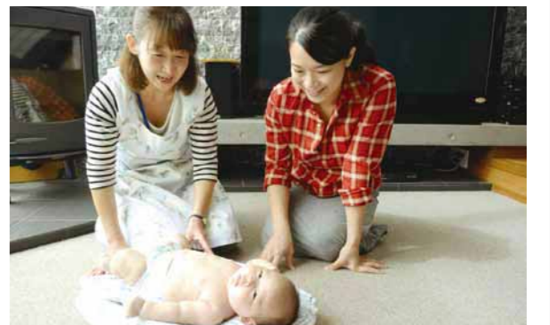
▲子育ての悩みの相談も

身近な地域で子育てのお手伝いをするボランティアを育成・支援する「子育て応援団Beenet」。会員との交流、講習会を開催します。 対象 高校生以上で子育てに関するボランティア活動ができる方 日時 12月3日(木)午前10時～11時30分 会場 子安市民センター 問い合わせ 子ども家庭支援センター ☎6568225)