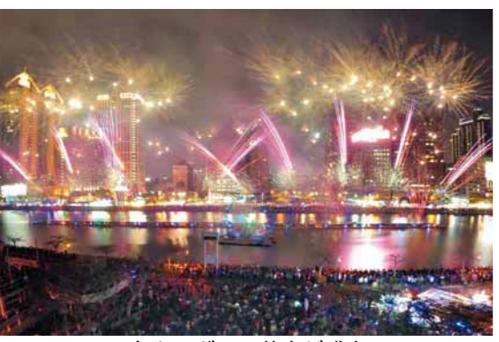
▲色とりどりの花火が盛大に

海外友好交流都市である台湾・高雄市で行われる「ランタンフェスティバル」を見学するツアーを開催します。詳しくは八王子観光協会(☎643-3115、☎643-3110)までお問い合わせください。 対象 市内在住・在勤・在学の方 期日 2月19〜22日(3泊4日) 定員 30名(先着順。最少催行人数は20名) 費用 125,000円(空港施設使用料などは別に必要) 申込期限 12月25日