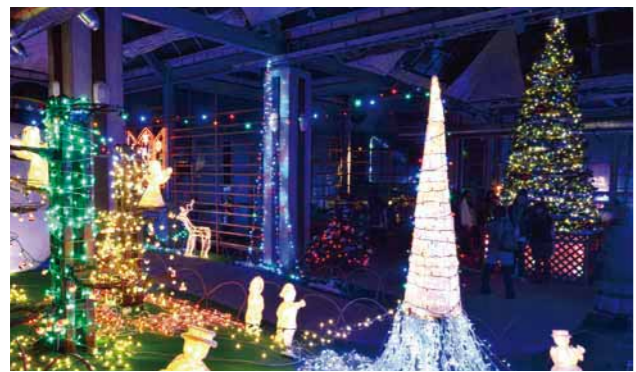
▲幻想的な空間に包まれて(昨年のような)

費用とは別に入場料が必要な催しもあります。 ■クリスマスイルミネーション 11月28日から12月27日まで、約8万球のイルミネーションが点灯します。時間は午後5時30分から8時45分まで(土・日曜日、祝日は5時から)。11月28日(土)には点灯式、週末にはクリスマスコンサートなどのイベントも開催します。