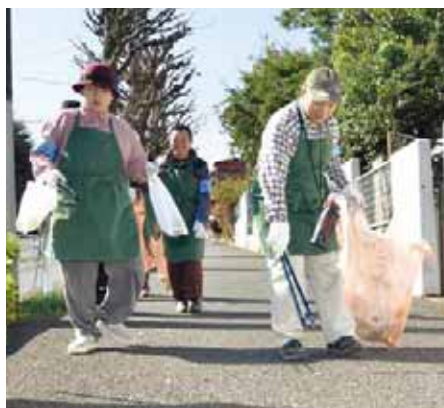
▲地域の道づくりにご協力を

植え込みの手入れなどを行い、道路の美化や地域の特色ある道づくりに協力していただける団体や企業を募集します。清掃や刈り込みなどに必要な用具は貸し出します。