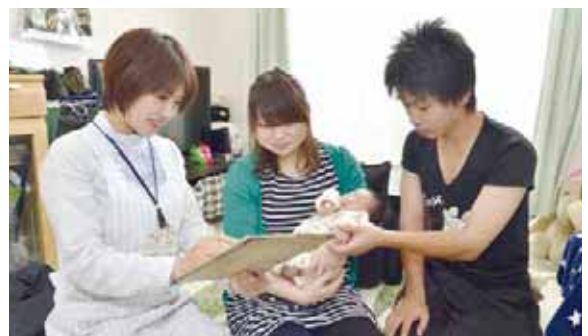
▲子育ての悩みの相談も

対象 市内在住で平成26年1～6月生まれのお子さんと保護者 内容 講話と実習(希望者にはだ液テストも) 期日・会場 ①12月2日(火)、②12月3日(水)