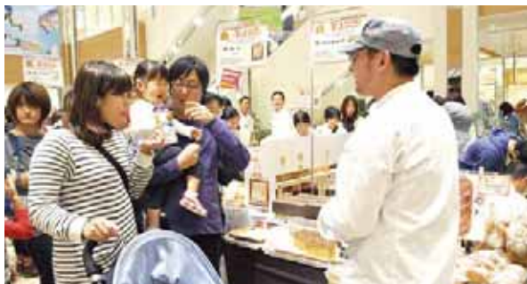
▲お気に入りの一品を

問い合わせ 八王子青年会議所(八王子商工会議所内 ☎623・6311、☎621・3527)、または観光課(☎620・7378、☎627・5951)へ