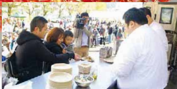
▲さまざまな「おいしい」が大集合