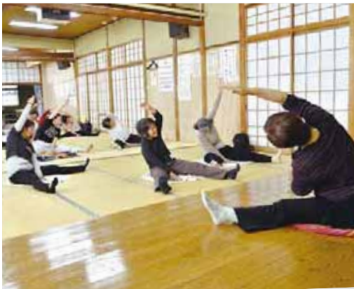
▲無理のない体操で健康づくり