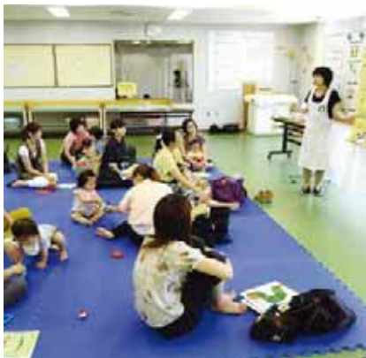
▲歯科衛生士が歯みがきの方法を紹介