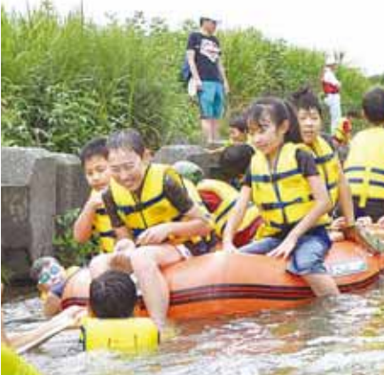
▲豊かな自然環境を未来に(浅川ガサガサ探検隊で)

申し込み 応募の動機と「地域の環境のために今私にできることは」についての作文(千字以内)、住所・氏名・年齢・職業・電話番号を書いて、1月9日(必着)までに直接、または郵送、Eメールで八王子市役所2階環境政策課(〒192-8501) ☎620・7384、FAX626・4416、FAXb110400@city.hachioji.tokyo.jp <