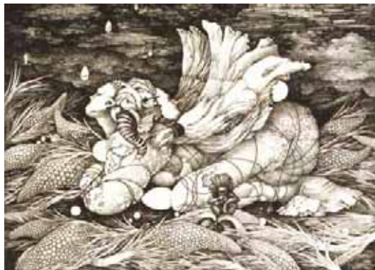
▲展示作品の「卵形のスフィンクス」