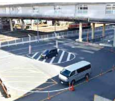
▲八王子駅南口の仮設自動車回転広場

現在、八王子駅南口の仮設自動車回転広場は、駐車してしまう方が多くいるため、対応に苦慮しています。今後は、本設にあわせて駐車禁止であることをさらに周知し、多くの方が円滑に利用できるよう努めていきます。なお、この広場は民間事業者の土地に設置しているため、スペースの拡大