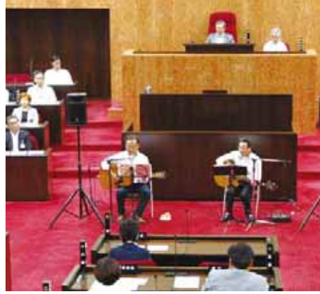
▲11月28日午前9時30分から議場コンサートを開催(前回のコンサートのようす)

第4回市議会定例会は、11月28日に開会します。本会議・委員会は傍聴ができますので、お気軽にお越しください。詳しくは議事課(☎620・7312、FAX626・2458)までお問い合わせを。市のホームページでもお知らせしています。