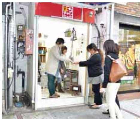
▲まちなかでのPRにご活用を

対象＝市内在住の小・中学生の保護者 内容＝高尾山学園や教育センター内の相談学級などの説明、施設見学、利用に関する相談 日時＝12月14日(日)午前10時～正午 会場＝教育センター 申し込み＝電話で教育センター(☎64-5124)