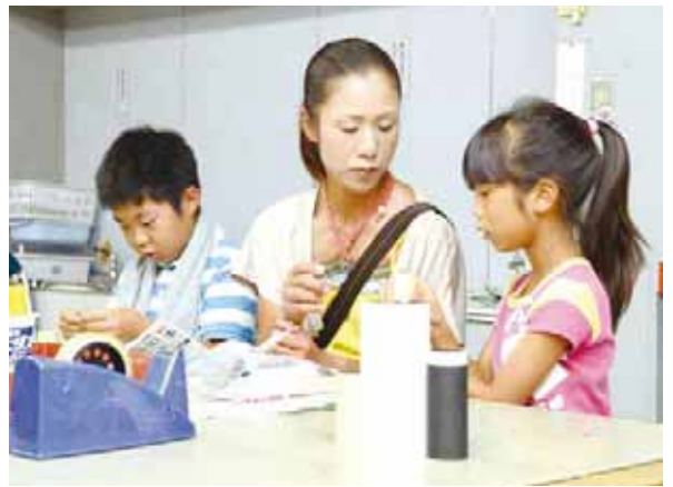
▲親子で協力しながら工作

申し込み ①～③不要、当日午前10時から工作券を販売、④⑦⑨不要、当日午前10時から整理券を配布、⑤⑥…不要、直接会場へ、⑧11月16日から電話、または市のホームページで