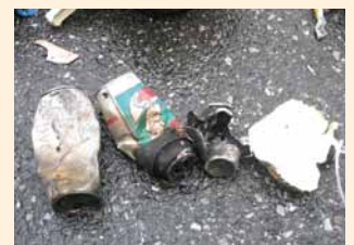
▲焼け跡から出たスプレー缶