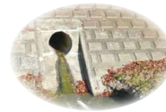
▲生活排水が流れ出ている吐口

なお、市ではこれら生活排水に関して「生活排水処理基本計画2014」を作成しました。市のホームページをご覧ください。