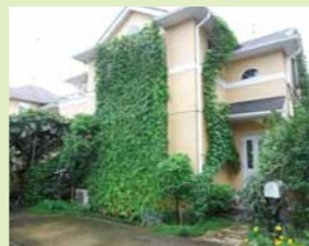
▲平成25年度最優秀賞受賞作品

応募用紙は、市役所2階環境政策課、各事務所、図書館、市民センター、エコひろばで配布しています。また、市やエコひろばのホームページからもダウンロードできます。