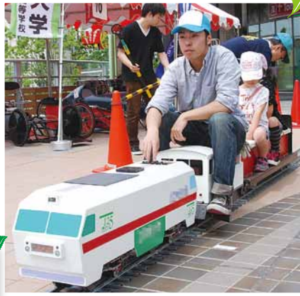
▲前回のアミューズメント風景