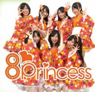
▲八王子ご当地アイドル 8princess