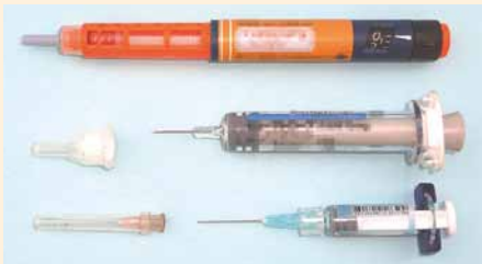
▲実際に混入していた注射器・注射針

注射針(ペン型含む)はごみ・資源物として出さず、購入した医療機関や保険薬局へお戻しください。