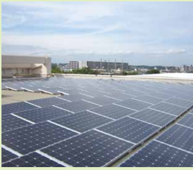
▲横山中学校の太陽光パネル

この方針では、太陽光、太陽熱、木質バイオマス熱について重点的に導入を進め、公共施設への設置を推進していくこと等を定めています。詳しくは市のホームページをご覧ください。