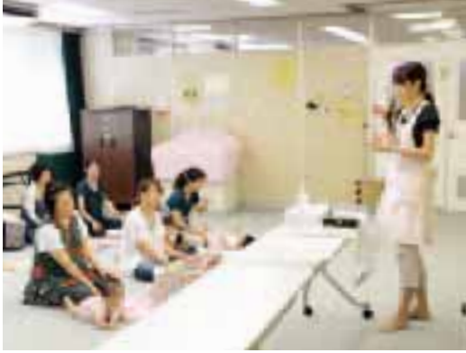
▲健康な歯を育てるために

市は、生後4か月までのあかちゃんがいるご家庭を訪問しています。保健師や訪問指導員が育児情報などを提供するとともに、子育てやお母さん自身の体調、心配に思うことなどの相談もお受けしています。対象者には、出生連絡カードをもとに保健福祉センターからご連絡します。なお、出生連絡カードは乳幼