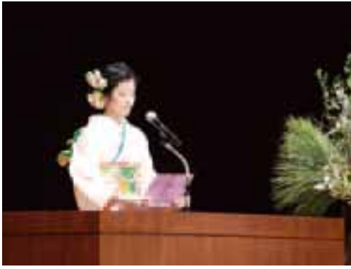
▲新成人の代表として舞台上に立ちませんか