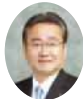
八王子市長 石森 孝志 たか ゆき