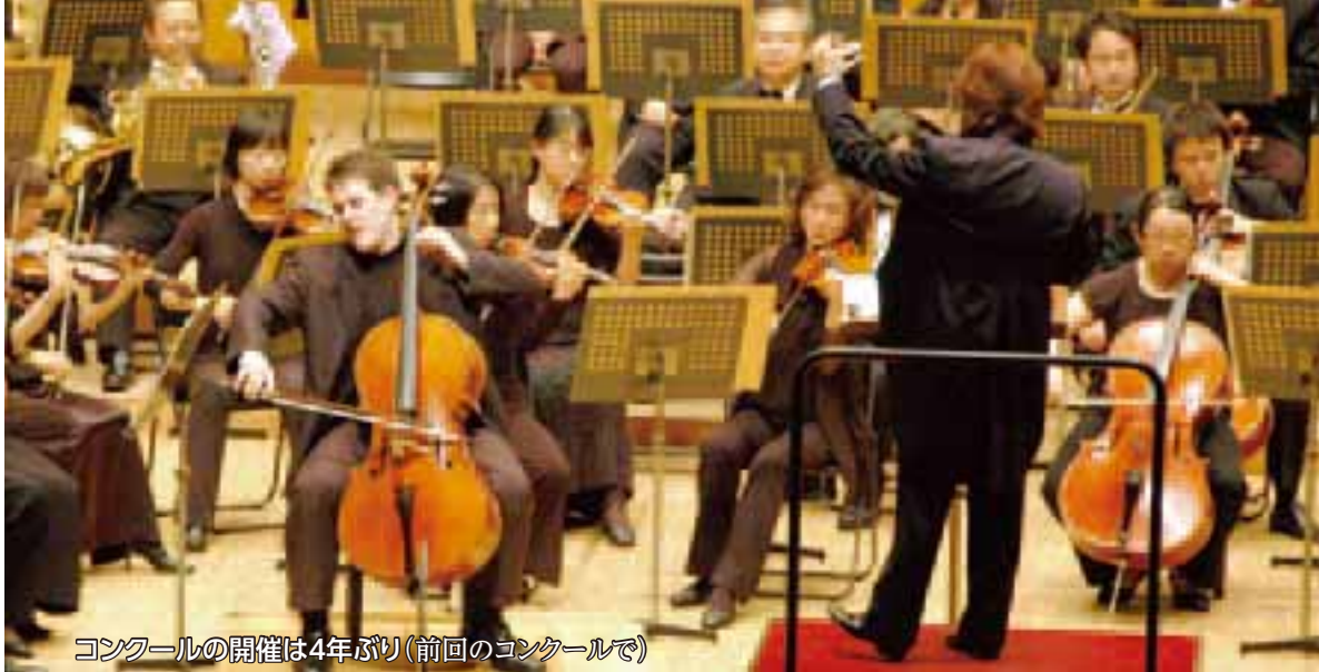
コンクールの開催は4年ぶり(前回のコンクールで)