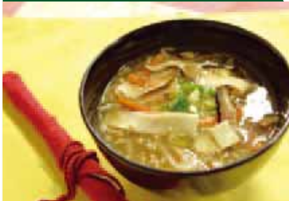
豚ひき肉を豚こま肉にかえても