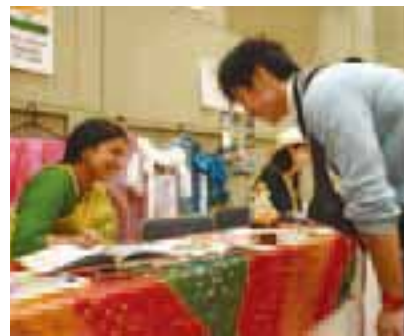
▲世界の文化にふれて

評会、新鮮な野菜の販売 日時 11月9・10日の午前10時～午後4時(10日は3時30分まで) 会場 富士森公園 問い合わせ 八王子(☎666・6511)、または農林課(☎620・7250)