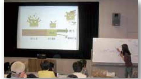
▲6月に開かれた講習会の様子