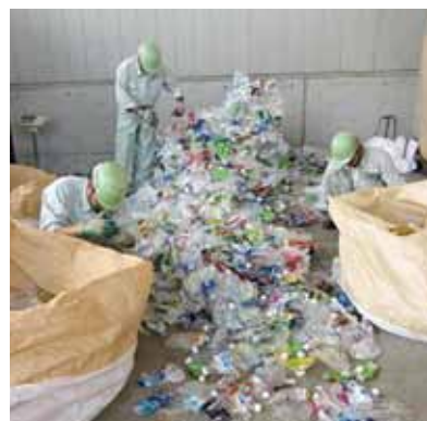
▲ペットボトルの品質検査

市で回収した容器包装プラスチックとペットボトルは戸吹町にあるプラスチック資源化センターで圧縮梱包し、容器包装リサイクル協会を通じて、再商品化事業者へ引き渡しています。協会では毎年その品質検査を実施しています。今年度行われた検査ではAランクという一番高い評価を受けることができました。これは市民の皆さんの分別に加え、プラスチック資源化センターで、汚れていて資源化できないものや異物を作業者が手で取り除いている結果です。これらの資源物の品質が良いと市の収入につながり、平成23年度は約1億4千4百万円でした。