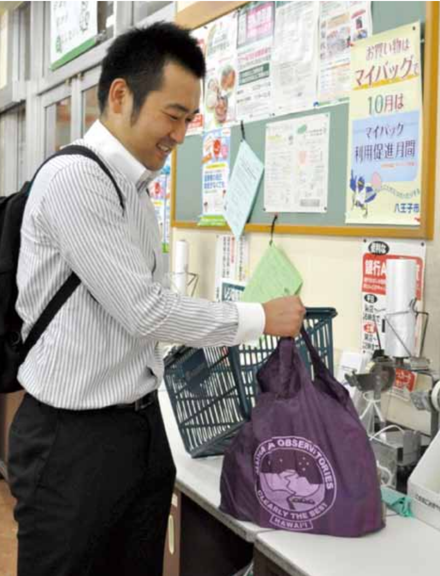
▲サラリーマンも仕事帰りにマイバッグでお買い物

■発行/ごみ減量対策課 〒192-8501 元本郷町三丁目24番1号 ☎620・7256(直通) FAX626・4506 ■ホームページアドレス http://www.city.hachioji.tokyo.jp/gomi/index.html