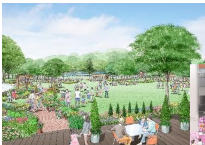
メイン会場となる富士森公園のイメージ