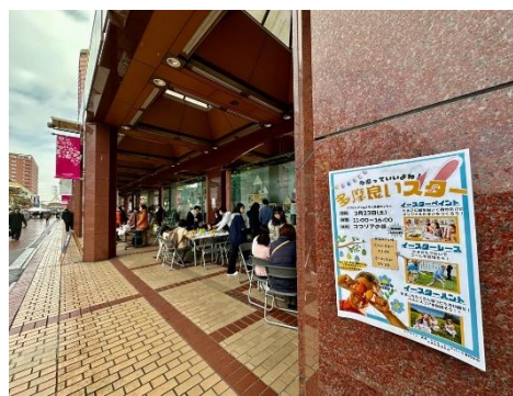
【実証イベントの様子】