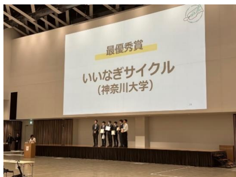
【ドラフト会議の様子】