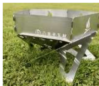
↑市内事業者によるオリジナル 焚火台