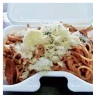
↑刻みタマネギがたっぷり