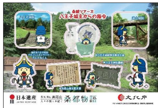
▲うじてるくんシール