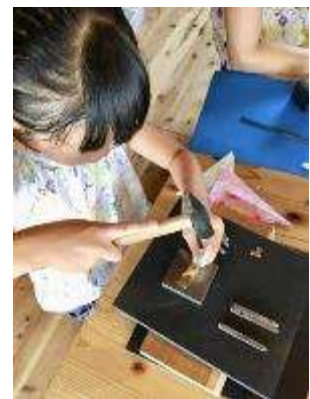
▲空想堂 （真鍮のジュエリーづくりなど）