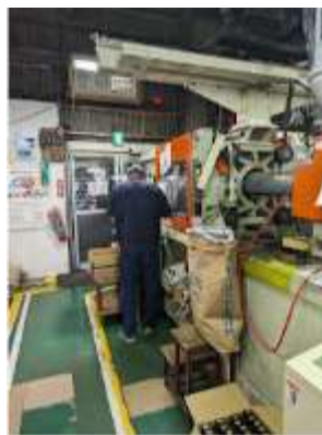
▲セイホー （プラスチック成型体験など）