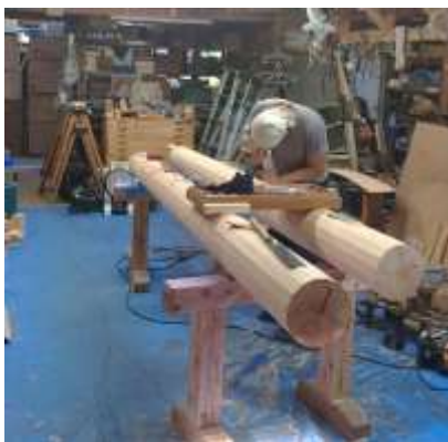
▲吉匠建築工藝 （鉋掛け体験など）