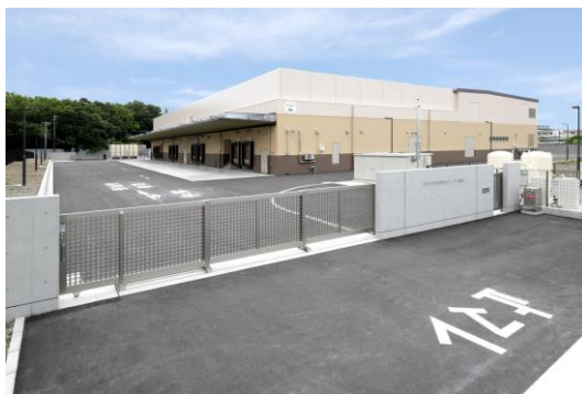
▲給食センター榎原（正門側）

給食センター榎原の施設及び開所式の取材が可能ですので、事前に学校給食課までご連絡ください。