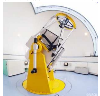
石垣島天文台・むりかぶし望遠鏡

https://www.city.hachioji.tokyo.jp/shisetsu/003/p011705.html