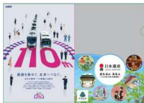
▲コラボグッズのクリアファイル