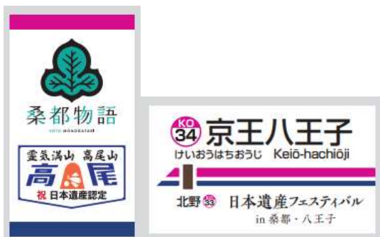
▲コラボグッズのキーホルダー