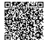
▲詳しくはこちらの 二次元コードから

1枚の用紙に5種類のスタンプを重ねて捺すことで、カラフルな1枚の作品が仕上がる「重ね捺しスタンプラリー」。日本遺産フェスティバル開催に向けて、八王子駅周辺、滝山城跡、八王子城跡の3エリアで順次開催します。