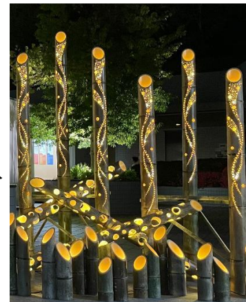
▲夜の竹あかりの様子 (写真はイメージです)