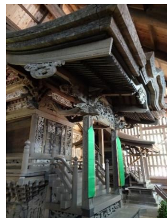
▲諏訪神社社殿 (市指定有形文化財)

「諏訪神社(鑑水)」は、今も残る神社の内の一つで、明治10年(1877年)に子(ね)の権現の社地に諏訪・八幡・子の権現の3社が合祀され、境内が整備されたものです。見事な彫刻が施された3つの社殿は、市の有形文化財に指定されているほか、境内には寄進者として鑑水商人の名前が刻まれた石灯籠、手水鉢などが残されています。(※谷戸=丘陵のU字型に浸食された谷状の地形)