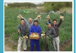
若手農家が地域を盛り上げています