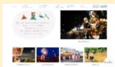
春夏秋冬イベント -季節の多彩なイベントを紹介-