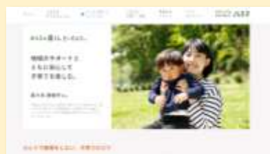
みんなの暮らし、きいてみた。 -6人の市民からリアルインタビュー-