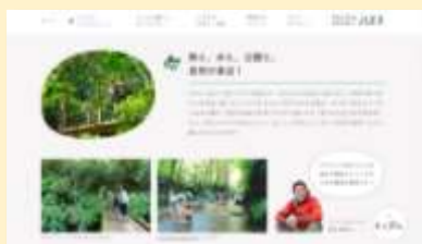
八王子のすてきなところ -八王子の暮らしやすさが満載です-

思わず誰かに話したくなる。そんなまちの魅力を発信するための「シティプロモーションサイト」。 買い物やグルメといった暮らしのことや、子育てや教育などの情報、日々を彩るイベントの紹介などさまざまな視点でまちの魅力を紹介しています。ほかにも、自分らしい「みち」を見つけて暮らしている市民の方のインタビューや、八王子の美しい風景が無料でダウンロードできるフォトギャラリーなどのコンテンツが満載。「あなたのみちを、あるけるまち。八王子」の魅力を再発見してみてください。