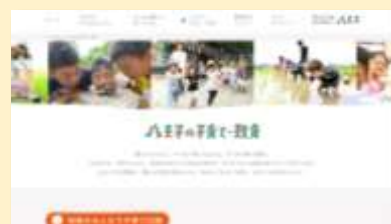
八王子の子育て・教育情報 -市独自の子育て・教育に関する取り組み-