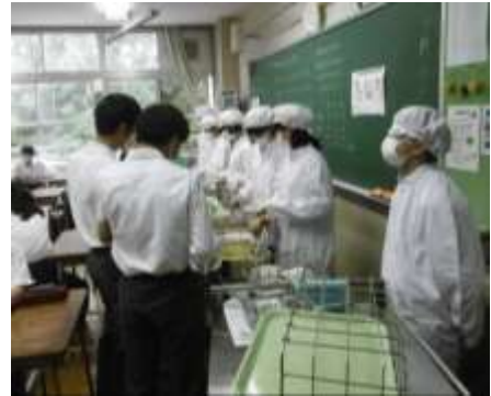
▲松木中学校での配膳の様子