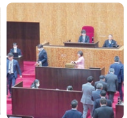
議長を除く全議員による記名投票