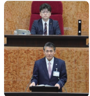
提案説明を行う初宿市長