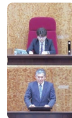
委員長による審査報告