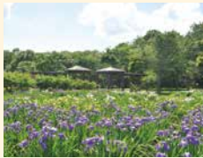
錦大沼ハナショウブ園

市の草の花「ハナショウブ」が、1万株以上植えられた植物園。7月ごろ、色鮮やかに咲き誇ります。