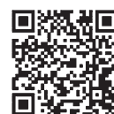
国民生活センター公式LINEアカウント

国民生活センターでは、消費者へ注意喚起情報などを公式LINEアカウントから情報発信中!