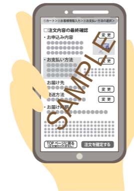
申込みの最終確認画面イメージ

動画サイトの広告からサプリメントをお試し価格で1回限りのつもりで注文したが、実際には、複数回の購入が条件の定期購入だった。解約したいと伝えたが、規定回数の購入が必要と言われた。