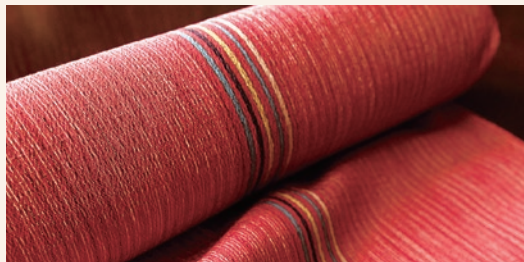
シンプルな柄や色で“粋”を愉しむ

八王子織物の長い歴史の集大成とされているのが、「御召織」や「紬織」など5種の技法からなる「多摩織」。シワになりづらく滑らかな触り心地が特徴で、着物やストール、名刺入れなどさまざまなシーンで使われ、日本遺産の構成文化財にもなっています。