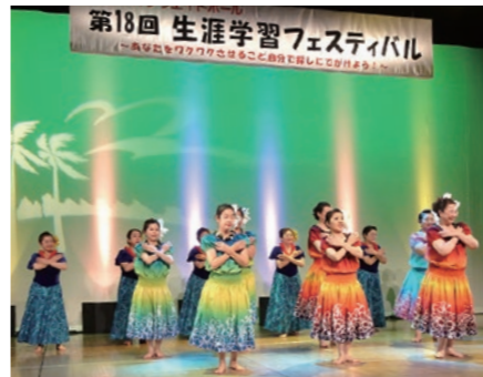
練習の成果を発表

10月28日(土)にクリエイトホー ルで開催する「生涯学習フェス ティバル」。文化・芸術・地域活動 など、日頃の学習活動の成果を 発表する市民団体を募集しま す。申込方法など、詳しくは各生