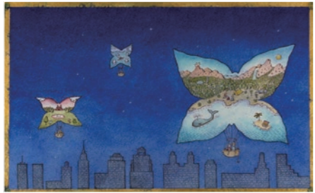
『Happy Children』1998年頃 『Cricket』誌の表紙用イラスト ©Peter Sis/エリック・カール絵本美術館寄託