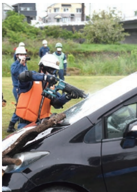
車両を使った救助の実演も