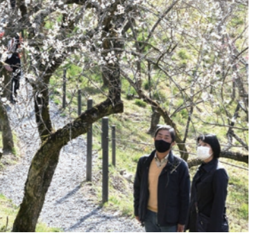
春の訪れを感じて

市内在住で令和4年5〜10月生まれのお子さんと保護者 内容 歯科衛生士による個別相談・歯みがき実習(希望者には唾液テストも) 日 会 ①4月6・7日: 陵南いちよう会館(東浅川町)、②4月11日(火): 南大沢保健福祉センター(☎679・2205)、③4月26日(水): 大横保健福祉センター(☎625・9200) 時 午前9時30分〜午後3時30分(①は11時