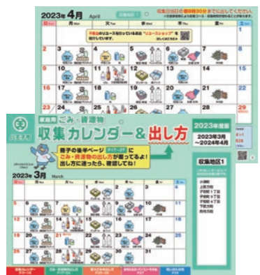
正しい分別にご協力

品目ごとの収集日や詳しい分別方法、出し方などを掲載した「2023年度版ごみ・資源物収集カレンダー」&「出し方」を、3月1日から全世帯へ配布します。14日を過ぎても自宅に届かない場合は、ごみ減量対策課までご連絡を。収集日やごみの出し方は、市のホームページ(右下の二次元コード)からご覧いただけます。