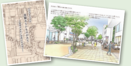
多くの市民や学生などの提案から制作された景観絵本

景観絵本の姿を実現するために実施している、市内大学(東京都立大学・工学院大学)との3つの協働研究のようすをパネル展示で紹介します。 日 3月10〜24日の午前8時30分〜午後7時(10日は1時から、12・19日は5時まで、24日は正午まで) 会 八王子駅南口総合事務所