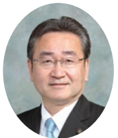
八王子市長 石森 孝志 たか ゆき